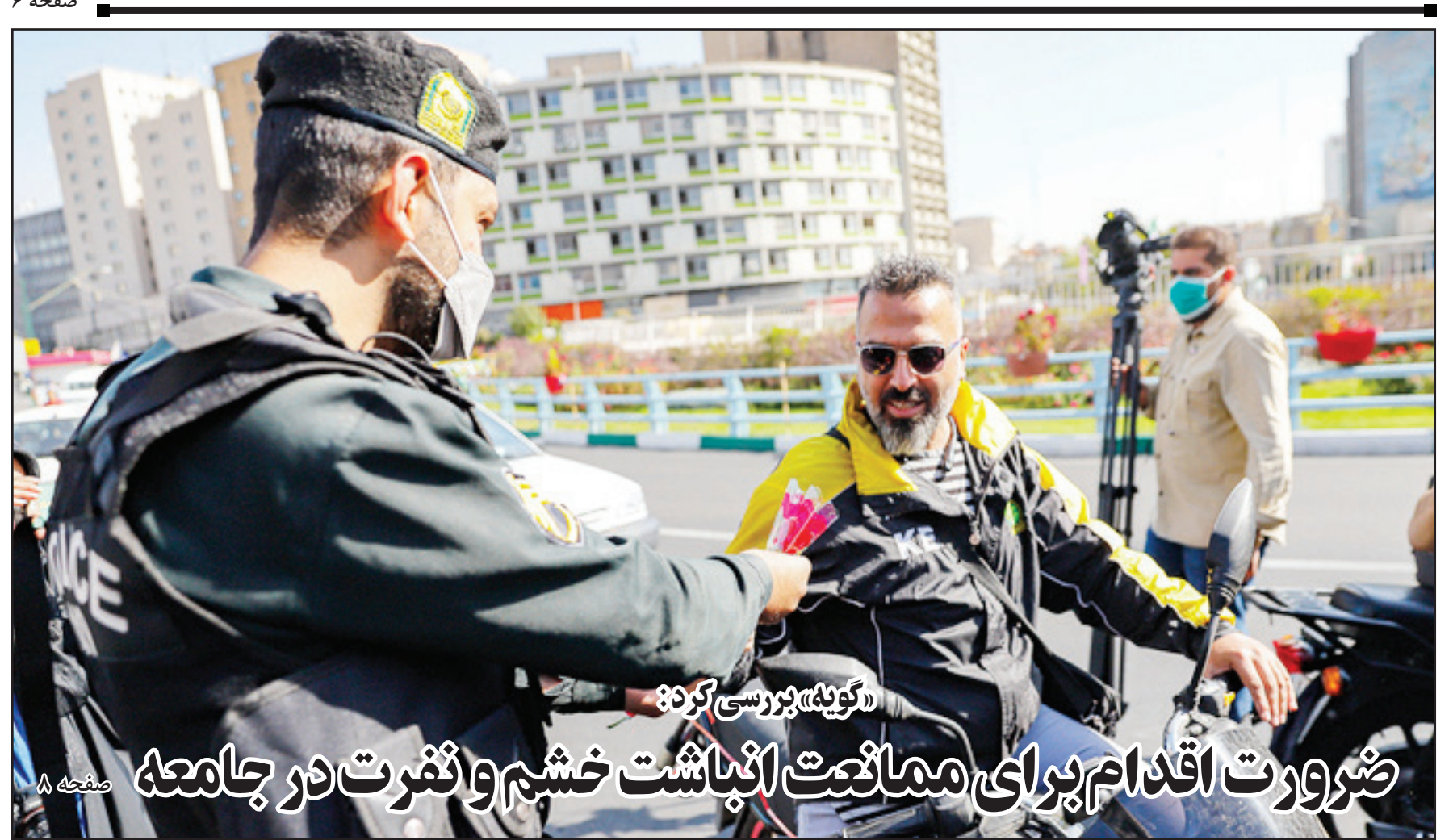
«گوپه» بررسی کرد: ضرورت اقدام برای ممانعت انباشت خشیم و نفرت در جامعه