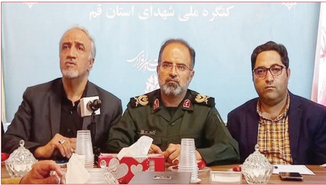
حماسه‌های ماندگار ایثارگران انقلاب نزدیک به ۲۰۰۰ دقیقه فیلم مستند در قالب این جشنواره با موضوع شهدای قم حضور داشتند.