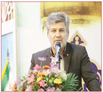
مهمترین تشکل بازنشستگی در استان قم کانون بازنشستگی تامین اجتماعی است که سعی شده است این تشکل تقویت شود.

مشکلات بیمه‌های اهالی رسانه بود. عاشوری با تاکید بر اینکه سیاست ما تقویت تشکلهای کارگری و بازنشستگی و استفاده از ظرفیت آن‌ها برای خدمت رسانی است، گفت: