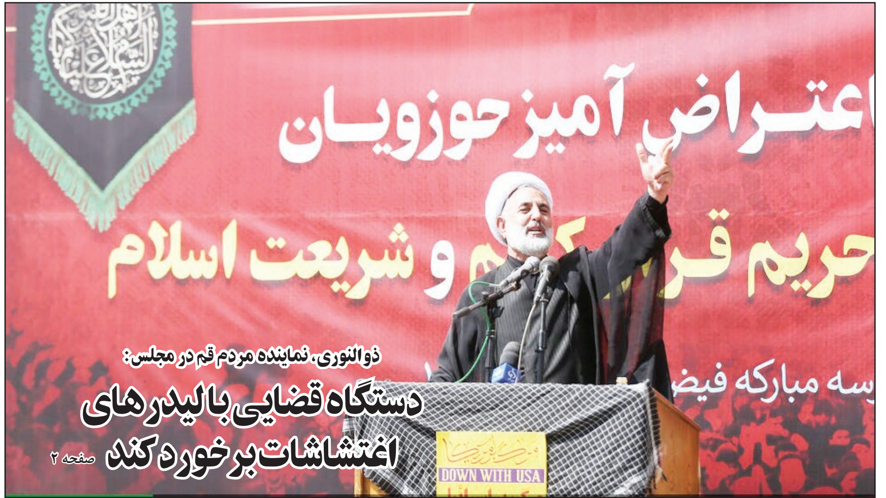
ذوالنوری، نماینده مردم قم در مجلس:

دستگاه قضایی با لیدرهای اغتشاشات برخورد کند صفحه ۲