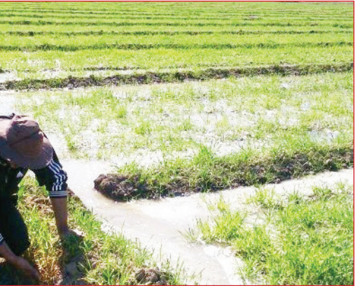
مدیرکل پدافند غیرعامل استان قم:

استقبال کشاورزان مواجه هستیم، همچنین عملکرد و بازدهی دیگر محصولات نیز در حال بررسی هستند. مجری الگوی کشت استان قم، بیان کرد: خوشبختانه کشاورزان استان قم در اصلاح الگوی کشت با وجود توجه اقتصادی طرح، جزء کشاورزان پیشرو هستند؛ و بزرگترین مانع در اجرای کامل طرح الگوی کشت این است که اعتبارات تخصیص داده شده جوابگوی این طرح نیست.