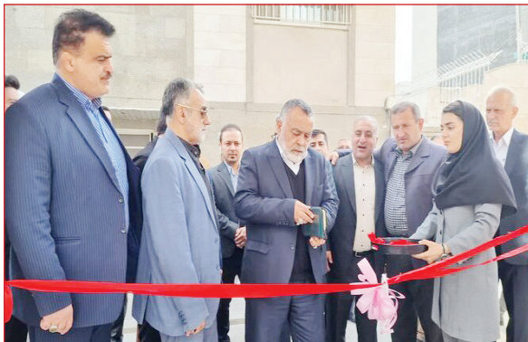
مدیر کل ورزش و جوانان مازندران

مدیرکل ورزش و جوانان مازندران با اعلام اینکه امروز برای انتخاب یک مدبر کل ورزش و جوانان استان مازندران یادآور شد: امسال ۲۰۵ مدال کسب کرده‌ایم اما امکانات ورزشی ما شایسته این افتخارات نیست.